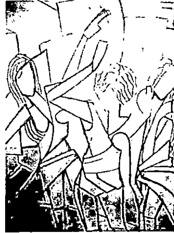
المرحلة الأولى شكل رقم (١) .