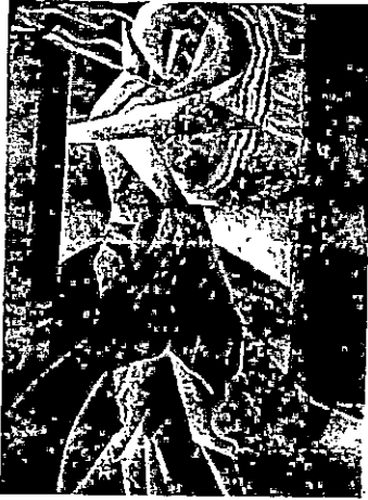
المرحلة الثانية شكل رقم (٦) .

اختارت الباحثة في هذا الكادر الفني للأداء المسرحي وجود شخصيتين محوريتان فقط يتم بهما وعليهما التكوين العام للعمل وهما لرجل وامرأة في وضع تعبيرى راقص وقامت الباحثة برسم عمودان قائمان بخلف الراقصان احدهما يميناً والآخر إلى يسارهما ويتوسط الراقصان اللوحة ويتقدمانها على طريق ممتد خلفهما كروية تشكيلية خاصة بالباحثة إلى جانب الكادر الاصلى المأخوذ من المسرح واستخدمت الألوان المناسبة للعمل من وجهة نظرها .