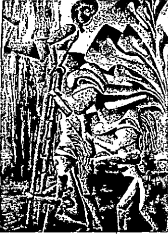
المرحلة الثانية شكل رقم (٤) .

اختارت الباحثة كادر فني يغلب عليه طابع الأداء المسرحي الحركي المتعدد الأوضاع لحركة الجسد فيوجد بالعمل أربع شخصيات تتحرك جميعا ولكن لكل حركة أو وضع دور مكمل في التكوين العام للوحة فهناك شخصية تصعد أعلى سلم بأداء حركي وجسدي رشيق والثلاث شخصيات الأخرى تبدو حركتهم للإمساك بالسلم فالشخصية الأولى تأتي ممسكة بالسلم في وضع الجلوس والأخرى تأتي واقفا والثالثة تقف خلفه لتساعده وتعيّنه على الإمساك بالسلم والى يمين العمل قامت الباحثة برسم شجرة كحل تشكيلي اضافي إلى التكوين الأساسي المستمد من المسرح واستخدمت درجات لونية متوافقة على حسب مآتراه من وجهة نظرها .