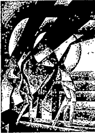
المرحلة الثانية شكل رقم (٨)

في هذا التطبيق قامت الباحثة باختيار الكادر الفني للأداء المسرحي لشخصين في وضع ادائي تعبيرى راقص وحركة جسدية إيقاعية متماثلة تشترك معهما الديكورات الخلفية والأضواء الجانبية في صنع وإتمام الشكل الكلي للتكوين مع استخدام مجموعة لونية مناسبة منتشرة بشكل عام في اللوحة لإعطاء مزيد من التأكيد على تضافر الحركة الإيقاعية للمؤدين مع شكل وخطوط الخلفية في شكل مريح من وجهة نظر الباحثة .