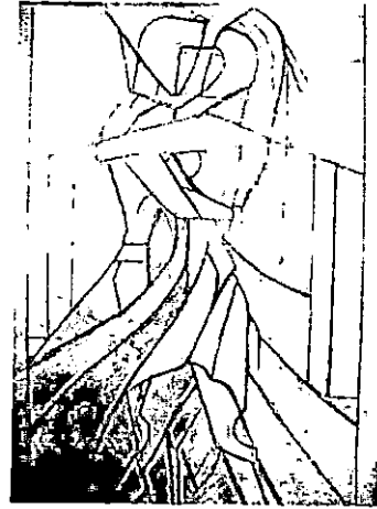
المرحلة الأولى شكل رقم (٥) .