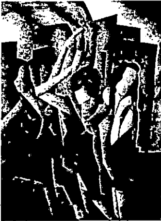
المرحلة الثانية شكل (٢) .

حاولت الباحثة إيجاد رؤية تشكيلية للاستفادة من شكل الأداء المسرحي بالكادر حيث توافرت فيه عناصر الحركة واللون والضوء وفيه تأكيد على الربط بين القيمة الحركية على المسرح والإيقاع كقيمة تشكيلية في اللوحة التصويرية المتمثلة في المؤديات الثلاث وحركاتهن الراقصة الإيقاعية باللوحة مع ثبات خطوط الأبنية والديكورات الخلفية لتأكيد الحركة الأمامية للمؤديات وإبرازها ومحاولة إيجاد تناسق واتزان لوني يجمع بين كل عناصر اللوحة .